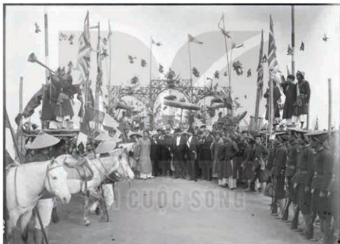
Lễ xướng danh khoa thi Hương năm Đinh Dậu tại Nam Định, ngày 27/12/1897, ảnh của Phi-a-manh Ăng-đơ-rê San (Firmin André Salles)

Nhà nước ba năm mở một khoa (2) , Trường Nam thú lẫn với trường Hà (3) . Lôi thôi sĩ tử vai đeo lọ (4) , Âm ọ quan trường miệng thét loa.