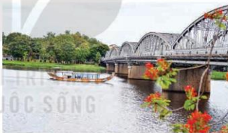
Cầu Trường Tiền

Xứ Huế vốn nổi tiếng với các điệu hò, hò khi đánh cá trên sông ngòi, biển cả, hò lúc cấy cây, gặt hái, trồng cây, chăn tằm. Mỗi câu hò Huế dù ngắn hay dài đều được gửi gắm ít ra một ý tình trọn vẹn. Từ ngữ địa phương được dùng nhuần nhuyễn và phổ biến, nhất là trong các câu hò đối đáp tri thức, ngôn ngữ được thể hiện thật tài ba, phong phú. Chèo cạn, bài thai, hò đưa linh buồn bã, hò giã gạo, ru em, giã vôi, giã điệp, bài chòi, bài tiệp, nường vung (2) náo nức nồng hậu tình người. Hò lơ, hò ô, xay lúa, hò nện (3) gần gũi với dân ca Nghệ Tĩnh. Hò Huế thể hiện lòng khao khát, nỗi mong chờ hoài vọng thiết tha của tâm hồn Huế. Ngoài ra còn có các điệu lí như: lí con sáo, lí hoài xuân, lí hoài nam (4) .