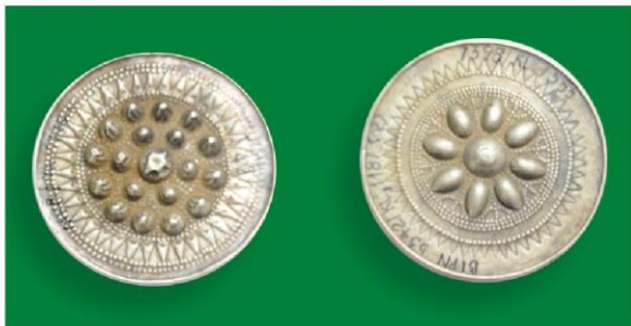
Hoa tai bạc của đồng bào dân tộc Khơ Mú (1)