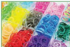
Dây thun/ thun (1)