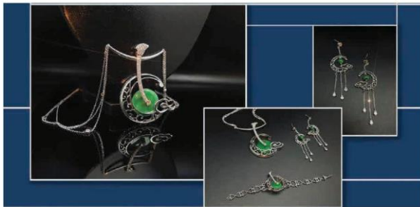
Bộ trang sức gồm vòng cổ, vòng tay và hoa tai (2)

Trang sức giúp nâng cao vẻ đẹp cũng như tượng trưng cho sự giàu có, quyền lực và địa vị của cá nhân sử dụng. Đối với một số người, trang sức là một hình thức nghệ thuật để thể hiện cá tính, phong cách riêng, sự sáng tạo và thẩm mỹ của bản thân. Cũng có một số người sử dụng đồ trang sức như một phần của truyền thống và văn hoá. Bên cạnh đó, sự phát triển của nền kinh tế giúp cho thu nhập khả dụng cao và khả năng chi tiêu của người dân ngày một lớn đang thúc đẩy nhu cầu tiêu thụ hàng hoá như đồ trang trí ngày càng tăng. Để nâng được giá trị sản phẩm và sự hấp dẫn với người mua, các nhà thiết kế hoạt động trong lĩnh vực này đã cho ra đời các loại sản phẩm phục vụ cho những sở thích, nhu cầu khác nhau của người tiêu dùng. Từ các loại nhẫn, hoa tai, lắc tay cho đến các vòng cổ,... đều được thiết kế ấn tượng và khác biệt, đáp ứng nhu cầu đa dạng của người tiêu dùng.