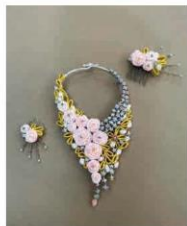
Đồ trang sức thủ công bằng vật liệu thông dụng (1)