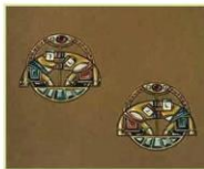
Bản phác thảo mẫu nhẫn từ môn đấu vật (1)