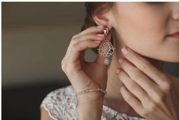
Hoa tai có thiết kế cầu kỳ (2)