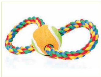
Vòng tay được làm từ kĩ thuật tết dây (2)

Kĩ thuật này thường được sử dụng trong kết hợp hai loại dây để làm dây đeo cho dây chuyền đeo cổ hay đeo tay. Để tết được hai loại dây khác nhau, có thể khác màu hay vật liệu, bạn cần cắt hai sợi dây có độ dài bằng nhau, sau đó vận hai sợi dây chuyển động theo chiều kim đồng hồ. Sau đó, lấy cả hai sợi dây buộc và xoắn chúng lại với nhau theo chuyển động ngược chiều kim đồng hồ để cố định lại có thể nhỏ keo lên đầu sợi dây để tránh bị xổ hay mở.