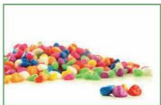
Hạt nhựa (3)