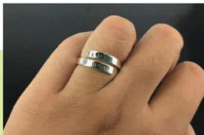
Nhẫn có thiết kế kiểu dáng hở (3)

Ngoài việc dùng để trang trí, nhẫn còn được sử dụng làm tín vật như nhẫn đính hôn, nhẫn cưới. Văn hoá này bắt nguồn từ châu Âu và ngày nay trở thành phong tục phổ biến cho cả nam và nữ ở nhiều nơi trên thế giới.