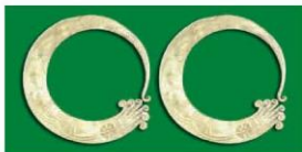
Hoa tai bạc của đồng bào dân tộc Mông (1)

Kiểu dáng, chất liệu, màu sắc và kết cấu của trang sức luôn được thiết kế phù hợp với nhiều mục đích cũng như đối tượng sử dụng sản phẩm. Tuy nhiên, màu sắc trong trang sức phần lớn là dùng màu tự thân của vật liệu nên nhà thiết kế thường khai thác việc tạo chất hay trang trí trên bề mặt sản phẩm.