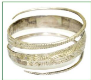
Vòng đeo tay bạc (2)