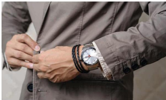
Bộ trang sức kết hợp hài hoà với trang phục (2)