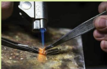
Kĩ thuật hàn kim loại trong thiết kế trang sức (1)

Kim loại hàn là hợp kim được dùng để liên kết các kim loại có nhiệt độ nóng chảy cao. Kim loại hàn được làm nóng chảy bằng nhiệt từ mỏ hàn, sau đó sẽ tràn vào bề mặt theo lực mao dẫn, cho phép kết nối các mối hàn lại với nhau.