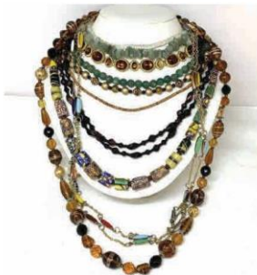
Bộ vòng đeo cổ (2)