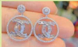
Hoa tai biểu tượng (3)

Trang sức gắn những biểu tượng kinh điển của các hãng thời trang: Đặc điểm thiết kế này thường gắn kết với các bộ trang phục, tạo nên sự đồng bộ, ấn tượng trong một tổng thể, cũng như truyền tải một thông điệp cụ thể về thẩm mỹ, phong cách.