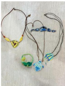
Vòng cổ chất liệu sơn mài, kết hợp xích và da (2)