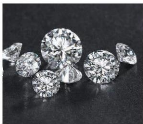
Kim cương (3)