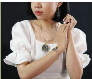
Trang sức tạo điểm nhấn (1)