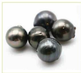
Ngọc trai đen (4)