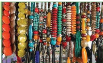
Vòng cổ làm từ hạt nhựa (4)