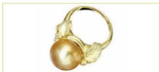
Nhẫn đeo tay (1)

Trang sức là những sản phẩm dùng để làm đẹp cơ thể như vòng đeo cổ, tay, khuyên, nhẫn,... thường được làm từ đá quý, kim loại quý hoặc các vật liệu sẵn có khác. Đồ trang sức được làm ra phải có kiểu dáng, màu sắc giúp người dùng để thao tác trong việc phối hợp với trang phục, phù hợp với cá tính, phong cách và hoàn cảnh của người dùng. Từ những bộ trang phục công sở, dạo phố cho đến những trang phục sự kiện sang trọng, luôn có phụ kiện và trang sức phù hợp đi kèm.