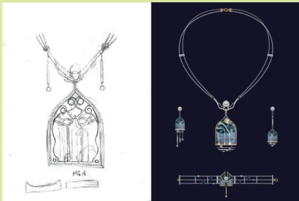
Bản vẽ phác thảo ý tưởng về một bộ trang sức gồm vòng cổ, vòng tay và hoa tai (1)

Công việc của nhà thiết kế trang sức là tạo ra những mẫu trang sức mới hấp dẫn mọi ánh nhìn, phù hợp với trang phục và đồ phụ kiện của người sử dụng. Để trở thành nhà thiết kế trang sức, trước tiên người học phải yêu thích và có đam mê sáng tạo. Cùng với đó, việc được đào tạo bài bản từ các trường dạy thiết kế mỹ thuật ứng dụng là những cơ sở quan trọng giúp nhà thiết kế biết cách tìm hiểu nhu cầu, thị hiếu của người dùng để lên ý tưởng, cũng như vận dụng kiến thức, kỹ năng trong lĩnh vực thiết kế để phác thảo, gia công chế tác các mẫu trang sức phù hợp.