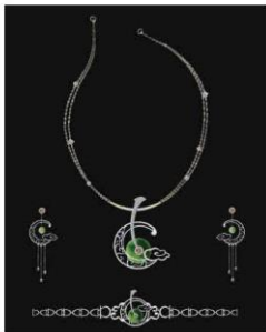
Bộ trang sức (3)