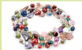
Vòng đính đá chùm (1)

Trang sức đính đá dạng chùm: Đính đá dạng chùm hầu như phổ biến với các sản phẩm trang sức trên khắp thế giới. Dạng thiết kế này thường xuất hiện trên các mẫu khuyên tai, dây chuyền và các sản phẩm trang sức khác. Mỗi sản phẩm trang sức theo dạng này đều thể hiện được kĩ thuật chế tác điêu luyện và khả năng sáng tạo của các nghệ nhân.