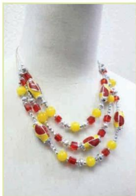
Vòng đeo cổ (2)