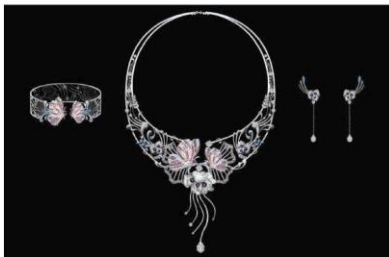
Bộ trang sức (1)

Phù hợp với trang sức sử dụng ngọc trai, kim loại đính một viên đá quý. Trang sức chọn theo một bộ sẽ tăng thêm sự bắt mắt, hài hoà đồng thời thể hiện được đẳng cấp của mình.