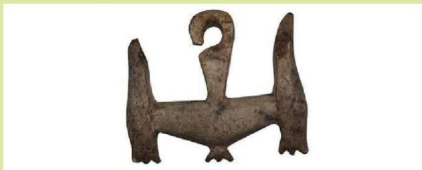
Hoa tai hai đầu thú, đá, văn hoá Sa Huỳnh, cách ngày nay khoảng 2 000 – 2 500 năm (3)

Bước sang thời dựng nước đầu tiên, một số đồ trang sức được sử dụng như bùa hộ mệnh và là vật không thể thiếu trong các nghi lễ tâm linh. Chất liệu chủ yếu là đá màu, mã não, đồng, thủy tinh,... Trong các di chỉ khảo cổ học thuộc các nền văn hoá Đông Sơn, Sa Huỳnh, Đồng Nai, Óc Eo,... đã phát hiện nhiều món đồ trang sức được chế tác hết sức cầu kì, tinh xảo. Chúng không chỉ làm cho người sử dụng trở nên sang trọng, quý phái mà còn thể hiện sự giàu có, sức mạnh và quyền lực của người đứng đầu mà khuyên tai hai đầu thú, ba màu, bốn màu là một ví dụ. Đặc biệt, những bao chân, bao tay gắn nhiều chuông nhỏ, vòng tay, trâm cài đầu bằng đồng, chuỗi hạt, khuyên tai bằng mã não, thủy tinh màu,... còn cho thấy sự đa dạng về loại hình của đồ trang sức thời kì này. Chúng ta có thể hình dung văng vẳng đâu đây âm thanh rộn ràng từ những chiếc chuông nhỏ gắn trên bao tay, bao chân bằng đồng của cư dân Đông Sơn phát ra theo nhịp điệu bước nhảy của các nghi lễ tâm linh thời đó.