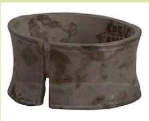
Hoa (khuyên, bông) tai hình ống, đá ngọc, Văn hoá Đông Đậu, cách ngày nay khoảng 3 000 – 3 500 năm (2)

Cách ngày nay khoảng 3 000 năm, cư dân văn hoá Phùng Nguyên, Đông Đậu đã sử dụng đồ trang sức một cách đa dạng và có vẻ cầu kì. Loại hình chủ yếu là vòng đeo tay, hoa tai, hạt chuỗi,... Nguyên liệu dùng làm đồ trang sức được lựa chọn là các loại đá có màu sắc đẹp, thớ mịn. Đặc biệt, kĩ thuật chế tác đã lên tới đỉnh cao. Một số đồ trang sức như vòng đeo tay, khuyên tai tạo dáng hình tròn khá hoàn hảo, bề mặt nhẵn mịn và trau chuốt.