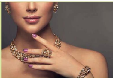
Bộ sản phẩm vòng, nhẫn (1)

Vòng: Hiện nay trên thị trường có rất nhiều loại vòng dùng để đeo cổ, đeo tay chân. Chúng được thiết kế riêng biệt hoặc kết hợp với nhẫn, hoa tai để tạo thành một bộ hoàn chỉnh.