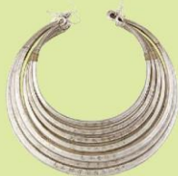
Vòng cổ bạc của đồng bào dân tộc Dao (2)

Trang sức luôn mang lại vẻ đẹp sang trọng và quý phái cho người sử dụng trong sinh hoạt thường ngày hay tham gia những sự kiện quan trọng. Do đó, đồ trang sức không những mang giá trị văn hoá tinh thần trong đời sống xã hội với ngôn ngữ biểu hiện riêng mà còn căn cứ vào giá trị quý hiếm của vật liệu, biểu tượng trong tạo dáng sản phẩm,... để làm tiêu chí xác định giá trị kinh tế, thước đo đẳng cấp hoặc địa vị trong xã hội.