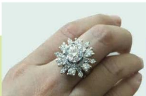
Nhẫn có thiết kế kiểu dáng kín (2)

Nhẫn: Nhẫn thường được sử dụng để đeo ngón tay và được thiết kế thành dạng vòng tròn khép kín hoặc hở. Nhẫn thường được làm bằng kim loại quý.