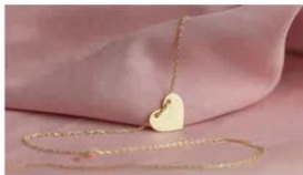
Mặt dây chuyền hình trái tim (3)

Theo em, đặc điểm nào của thiết kế trang sức là quan trọng nhất? Vì sao?