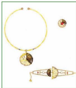
Bản vẽ thiết kế bằng chất liệu màu nước (4)