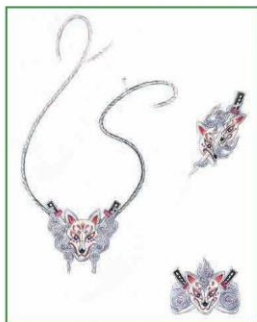
Bản vẽ thiết kế bằng chất liệu màu chì (1)