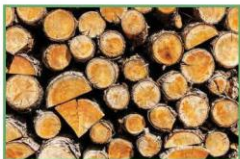
Cành cây khô (5)