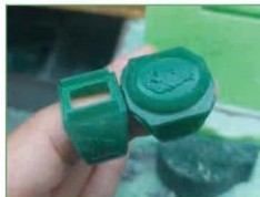
Mẫu nhẫn bằng sáp (2)

Hãy lựa chọn một loại trang sức để vẽ phác thảo.