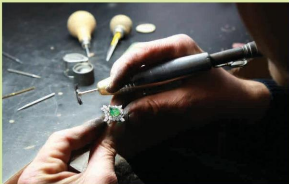
Kĩ thuật đính hạt trong thiết kế trang sức (2)

Kĩ thuật này được sử dụng để gắn đá hay một loại vật liệu khác lên mặt dây chuyền. Khi gắn hai vật liệu khác nhau, cần tìm hiểu kĩ về loại keo gắn phù hợp. Để gắn chắc chắn và sử dụng lâu bền, cần dùng vải khô loại bỏ bụi hoặc dầu mỡ. Sau đó, nhò một giọt keo vào vùng cần đính và dàn keo trải đều trên bề mặt. Đặt viên đá vào vị trí và để keo khô hoàn toàn.