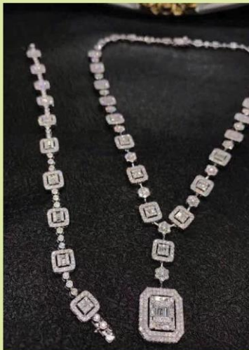
Sản phẩm đồ trang sức của nghề kim hoàn ở Châu Khê (1)