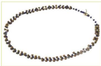
Dây chuyền của đồng bào dân tộc Xơ Đăng (1)