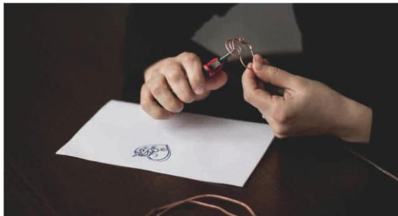
Kĩ thuật mở và đóng vòng tròn trong thiết kế trang sức (1)

Kĩ thuật này thường được sử dụng trong làm nhẫn đeo tay. Để có thể uốn được dây thép cứng thành một vòng tròn theo cỡ tay người đeo, cần sử dụng hai kim mũi phẳng để uốn và đóng vòng. Nếu vòng dây thép không đóng hoàn toàn, có thể sử dụng kim mũi phẳng bóp nhẹ.