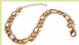
Vòng dạng xích (2)

Trang sức dây xích: Trang sức dạng dây xích cũng khá phổ biến. Trong đó, vòng cổ và vòng tay là hai loại trang sức được thiết kế nhiều theo dạng này. Nhiều mẫu trang sức được thiết kế dạng dây xích với bản khá lớn để tạo ấn tượng mạnh trước mọi ánh nhìn.