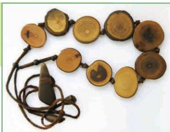
Vòng cổ làm từ cành cây khô (6)