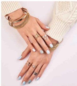
Bộ trang sức kết hợp với trang phục mùa đông (1)

Thiết kế và tạo mẫu một đồ trang sức phù hợp với bộ trang phục em yêu thích bằng vật liệu sẵn có.