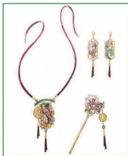
Bản vẽ thiết kế bằng chất liệu màu nước (2)