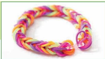
Vòng tay làm từ dây thun/ thun (2)