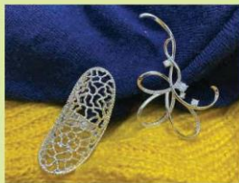
Nhẫn và ghim cài áo (4)

Trang sức mỹ kĩ: Dạng trang sức này được chế tác chủ yếu bằng các vật liệu kim loại giá trị thấp và thông dụng để có thể sản xuất hàng loạt, giảm giá thành như ni-ken, đồng,... Ở loại trang sức mỹ kĩ, khi vật liệu được chế tác thành mẫu trang sức thì công đoạn cuối để có được sản phẩm hoàn chỉnh là xi mạ nhằm phủ lên bề mặt mẫu trang sức một lớp kim loại cao cấp như vàng, bạc,... giúp cho các phụ kiện trang sức này trở nên có tính thẩm mỹ, lấp lánh và đẹp mắt hơn.