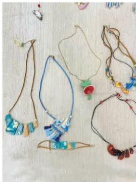
Vòng cổ chất liệu gốm, bạc và đá màu (1)