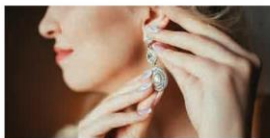
Hoa tai xỏ khuyên (1)

Hoa tai: Hoa tai thường được chế tác để gắn vào tai bằng hình thức xỏ khuyên hoặc kẹp. Hoa tai có thể đeo ở vị trí dải tai, vành tai hoặc xung quanh vành tai theo sở thích.