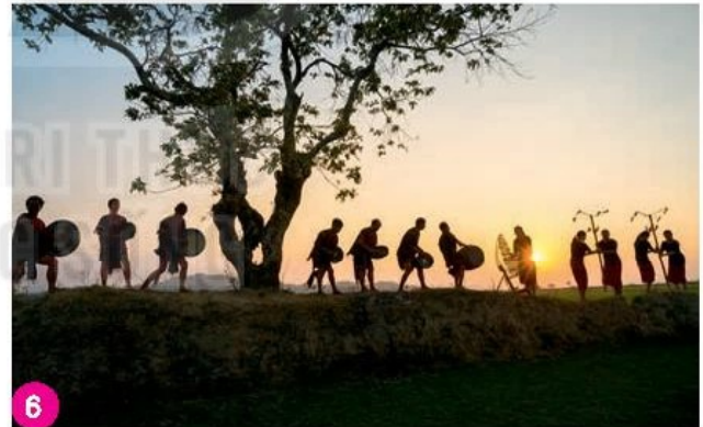
Không gian văn hoá Cồng chiêng Tây Nguyên