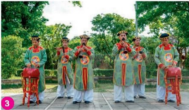
Nhã nhạc cung đình Huế, Thừa Thiên Huế