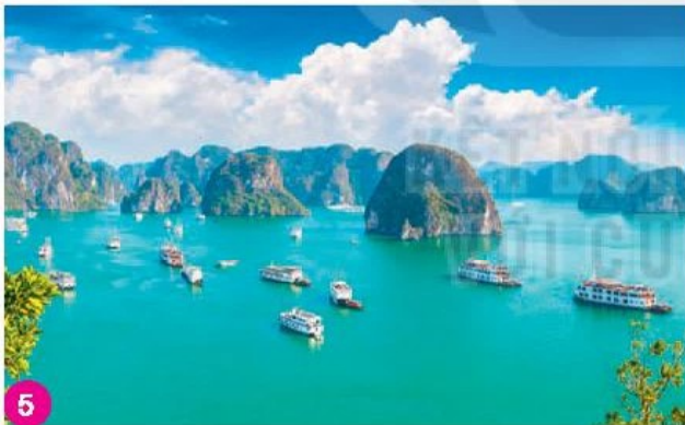
Vịnh Hạ Long, Quảng Ninh