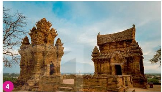
Tháp Chăm, Ninh Thuận