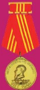
HUÂN CHƯƠNG HỒ CHÍ MINH