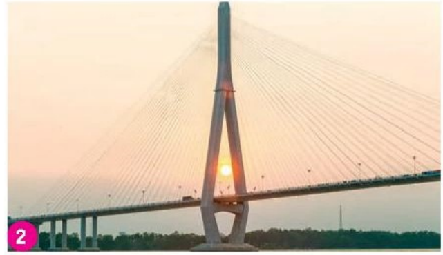
Cầu Cần Thơ, thành phố Cần Thơ