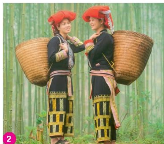
Người Dao Đỏ ở Lào Cai trong trang phục truyền thống