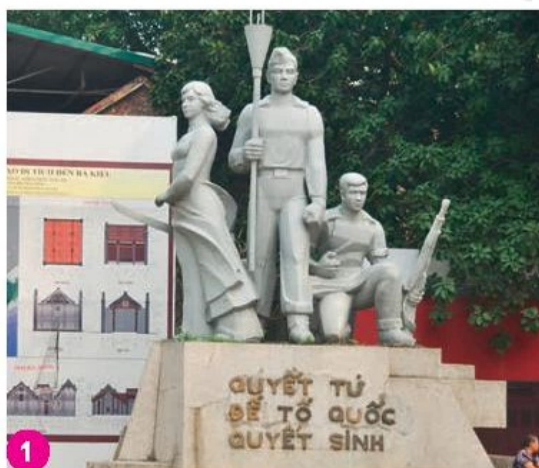
Tượng đài Quyết tử để Tổ quốc quyết sinh, Hà Nội

Em hãy quan sát các hình ảnh dưới đây và trả lời câu hỏi: