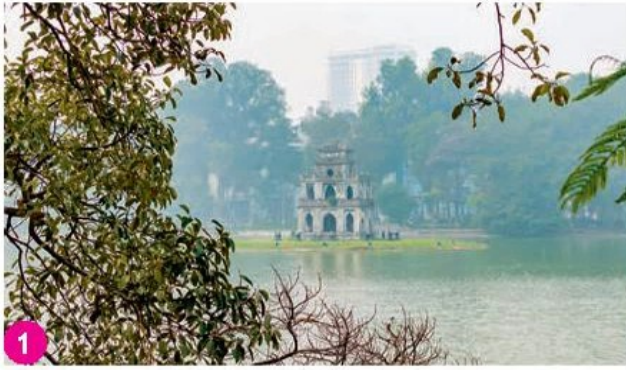
Hồ Gươm, Hà Nội